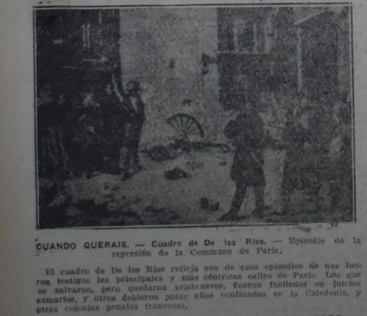
CUANDO QUERAIS. — Cuadro de De los Ríos. — Episodio de la represión de la Commune de París.

LEA el "ANUARIO SOCIALISTA", Año 1930 El ejemplar $ 1.— Librería "La Vanguardia"