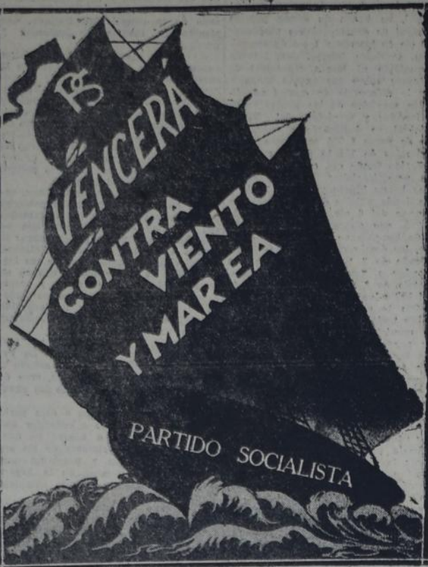
REPRODUCCION FACSIMILAR DEL NUEVO Y HERMOSO CARTEL A DOS COLORES PREPARADO POR LA COMISION ELECTORAL DEL PARTIDO SOCIALISTA.

La nave socialista, que ha resistido, gallarda e invencida, cien embates traidores y la prueba de cien borrascas, avanza, avanza, avanza contra viento y marea, afilada su proa triunfadora, firme y segura, por el rumbo cierto, la vista de sus tripulantes, firme y segura la mano de su timonel, firme y segura, la vieja y gloriosa insignia de históricas batallas.